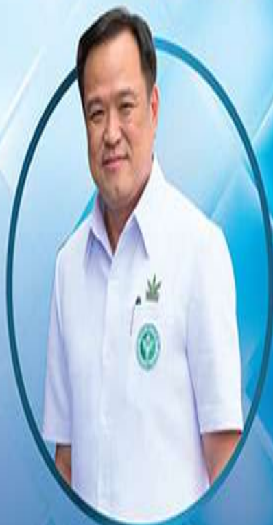
โดย นายอนุทิน ชาญวีรกูล รองนายกรัฐมนตรีและรัฐมนตรีว่าการกระทรวงสาธารณสุข

1 ใช้มาตรการสาธารณสุข ขับเคลื่อนและฟื้นฟูเศรษฐกิจ นำมาตรการสกัดกั้นสู่สภาวะปกติ ประชาชนกลับมาใช้ชีวิตได้ใกล้เคียงกับ ภาวะปกติยิ่งขึ้น