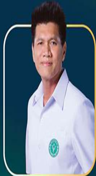
โดย ดร.สาริต ปิตุเตชะ รัฐมนตรีช่วยว่าการกระทรวงสาธารณสุข

การประชุมมอบนโยบายผู้ว่าการกระทรวงสาธารณสุข ประจำปีงบประมาณ พ.ศ. 2565 ในวันที่ 18 ตุลาคม 2564 สำนักงานผู้ว่าการกระทรวงสาธารณสุข